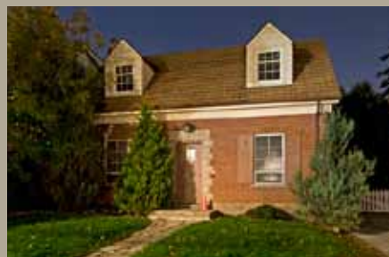
Sous-station 640, chemin Millwood