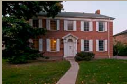
Sous-station 555, rue Spadina

Sheila Ascroft, rédactrice et réviseure à Ottawa, collabore à Héritage depuis 1997. Elle écrit aussi pour le magazine Ottawa Outdoors et le site www.womenscycling.ca . Vous pouvez la joindre à www.sheilaascroft.com .