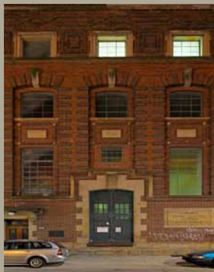
Sous-station 29, rue Nelson