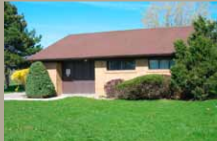
Sous-station maison Scarborough